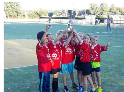
Kampioenen gr 3/4

In september werd gestart met het korfbaltoernooi, georganiseerd door KV Wageningen. Daar hadden 4 teams aan meegedaan. Naast goed samenspel, vele gescoorde punten, gewonnen en verloren wedstrijden, was er vooral veel plezier! Het team uit groep 4 wist zelfs een finaleplaats te bereiken en de grootste beker (1 e plaats) te winnen.