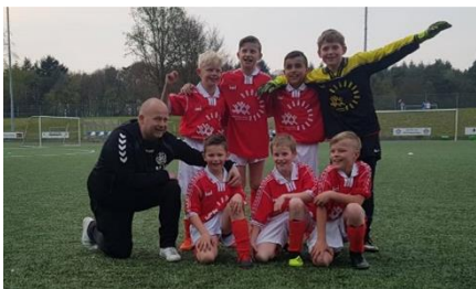
Gr 5/6 Kampioenen van Wageningen

In maart en april werden de voorrondes en finale gespeeld van het schoolvoetbaltoernooi. Daar deden rond de 90 leerlingen aan mee, verdeeld over 6 jongensteams en 4 meidentteams. Na spannende voorrondes mochten 3 jongensteams en