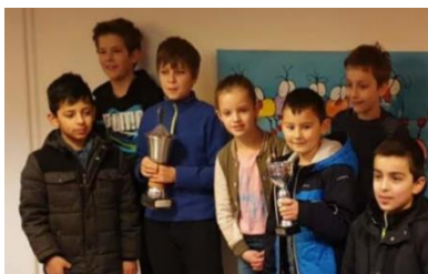
Zingen voor de schakers

In januari stond het schaaktoernooi gepland, georganiseerd door Schaakvereniging Wageningen. Zeven schakers uit midden- en bovenbouw gingen de strijd aan met andere Wageningse scholen. Als school hadden ze goed gepresteerd en mocht de groep door naar de finale. Daarnaast werd de individuele 1 e plaats behaald in de categorie middenbouw én bovenbouw.